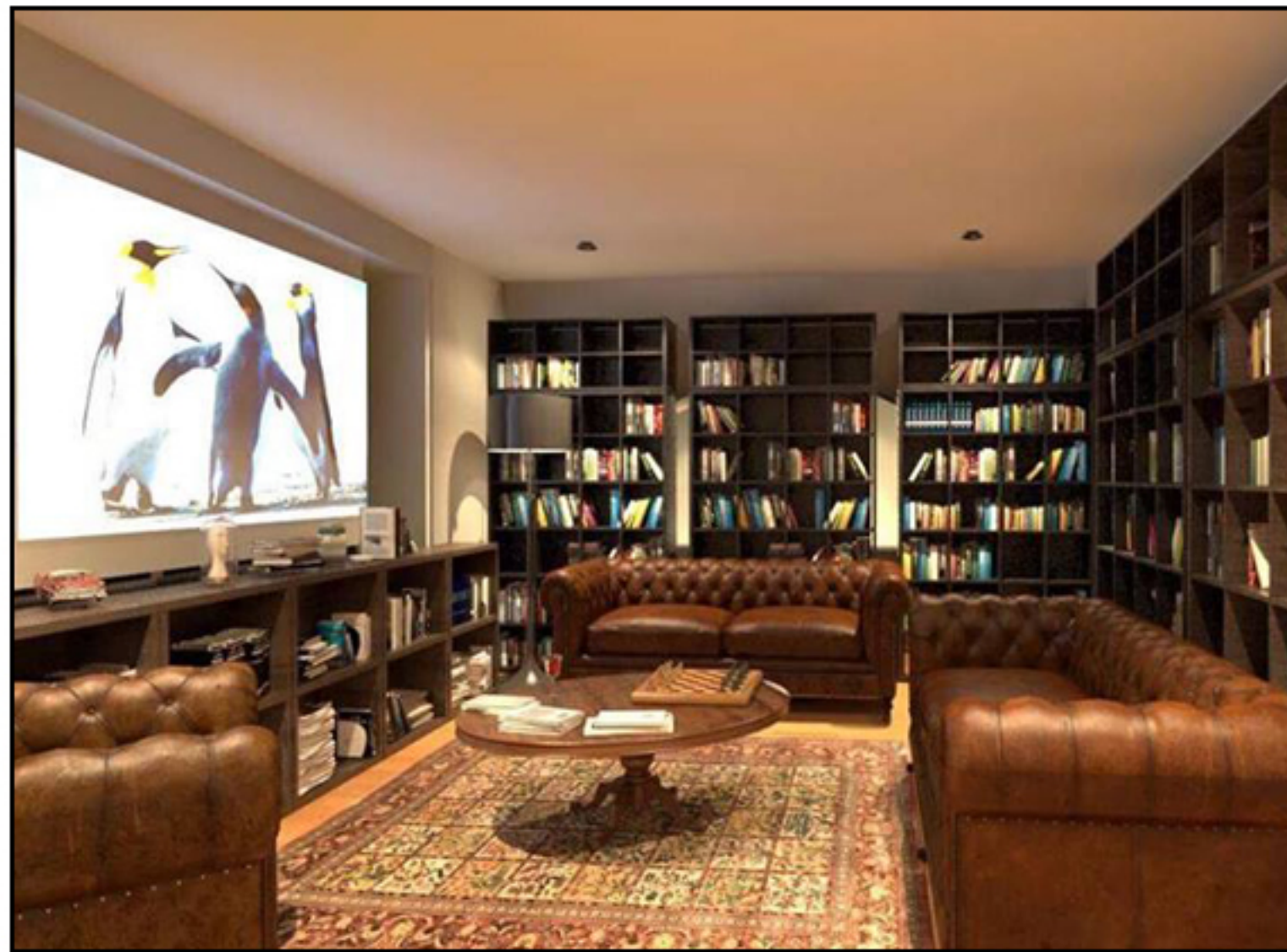
KOMAD 1F書斎・シアタールーム