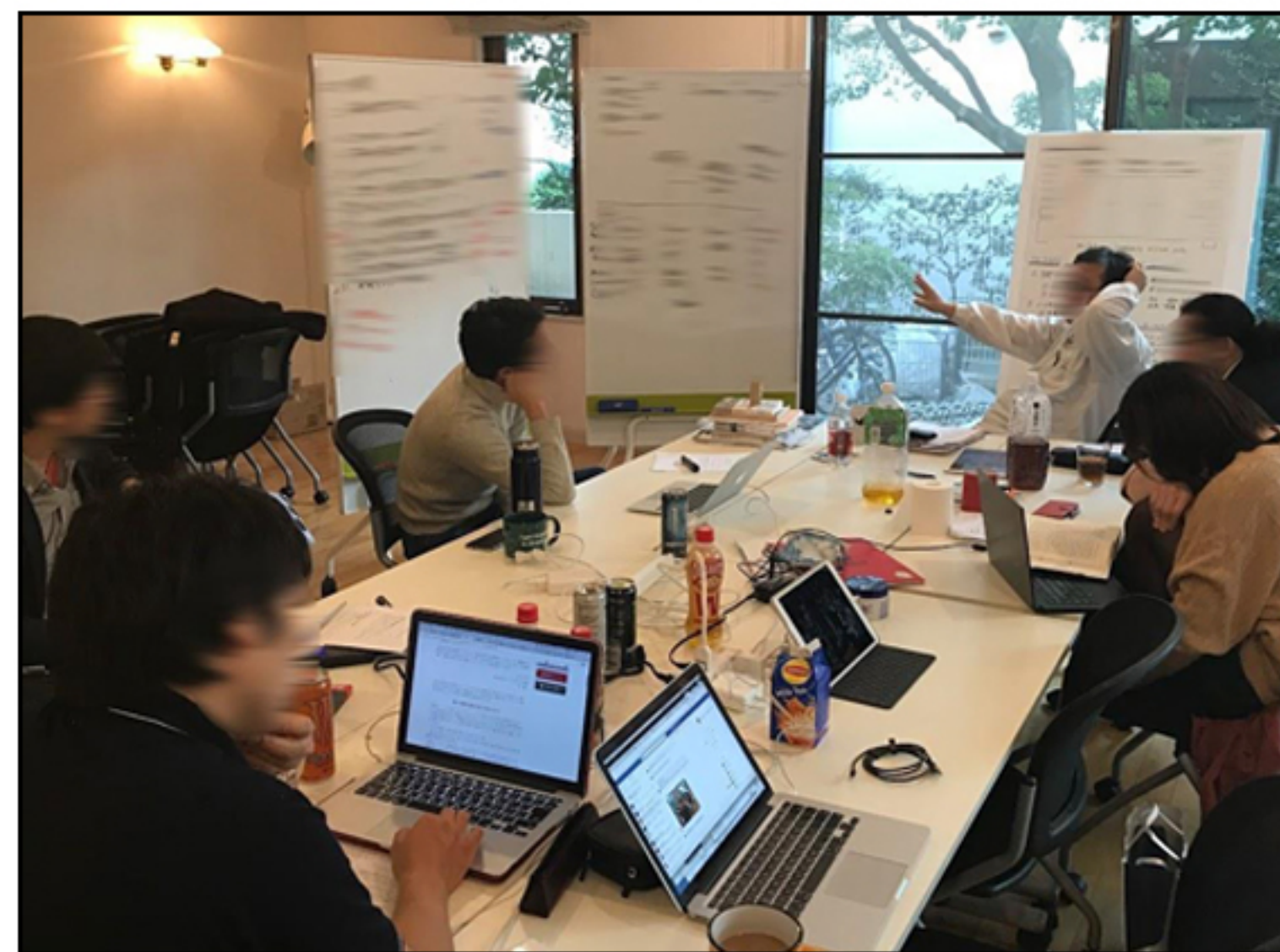
KOMAD 学生及び教授の講義の様子3