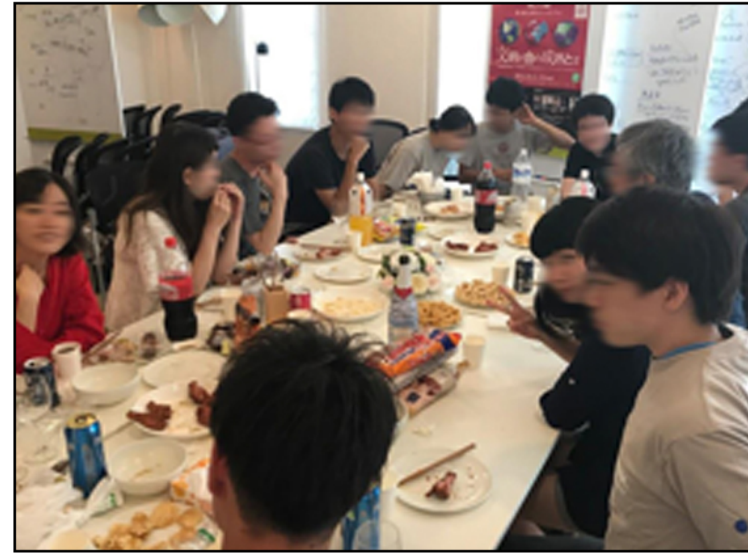
KOMAD イベント・食事会の様子2