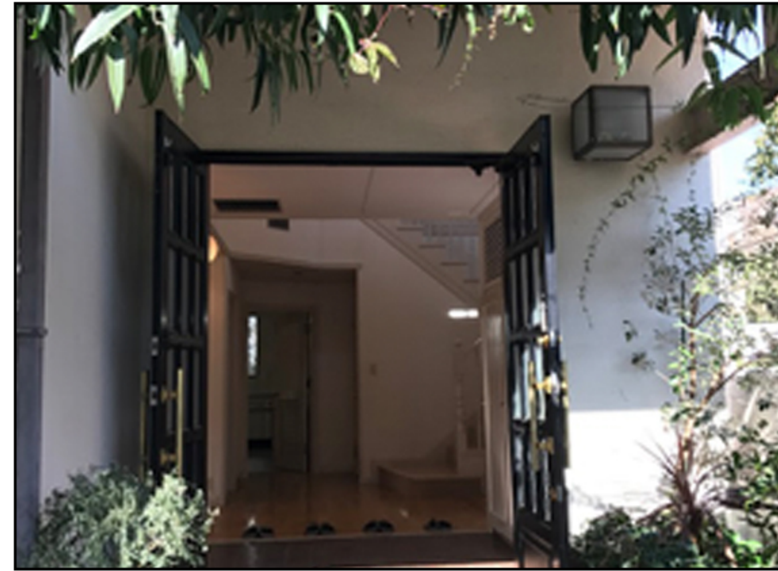
東京オフィス・KOMAD エントランス