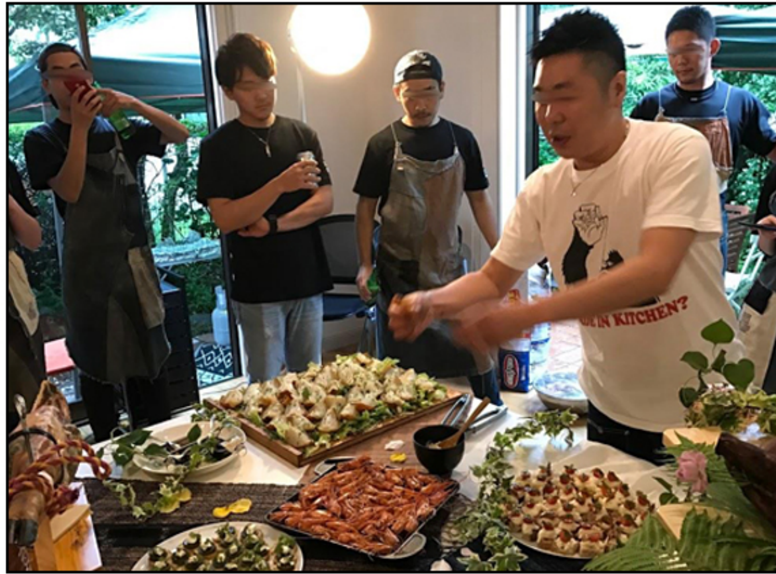
KOMAD イベント・食事会の様子