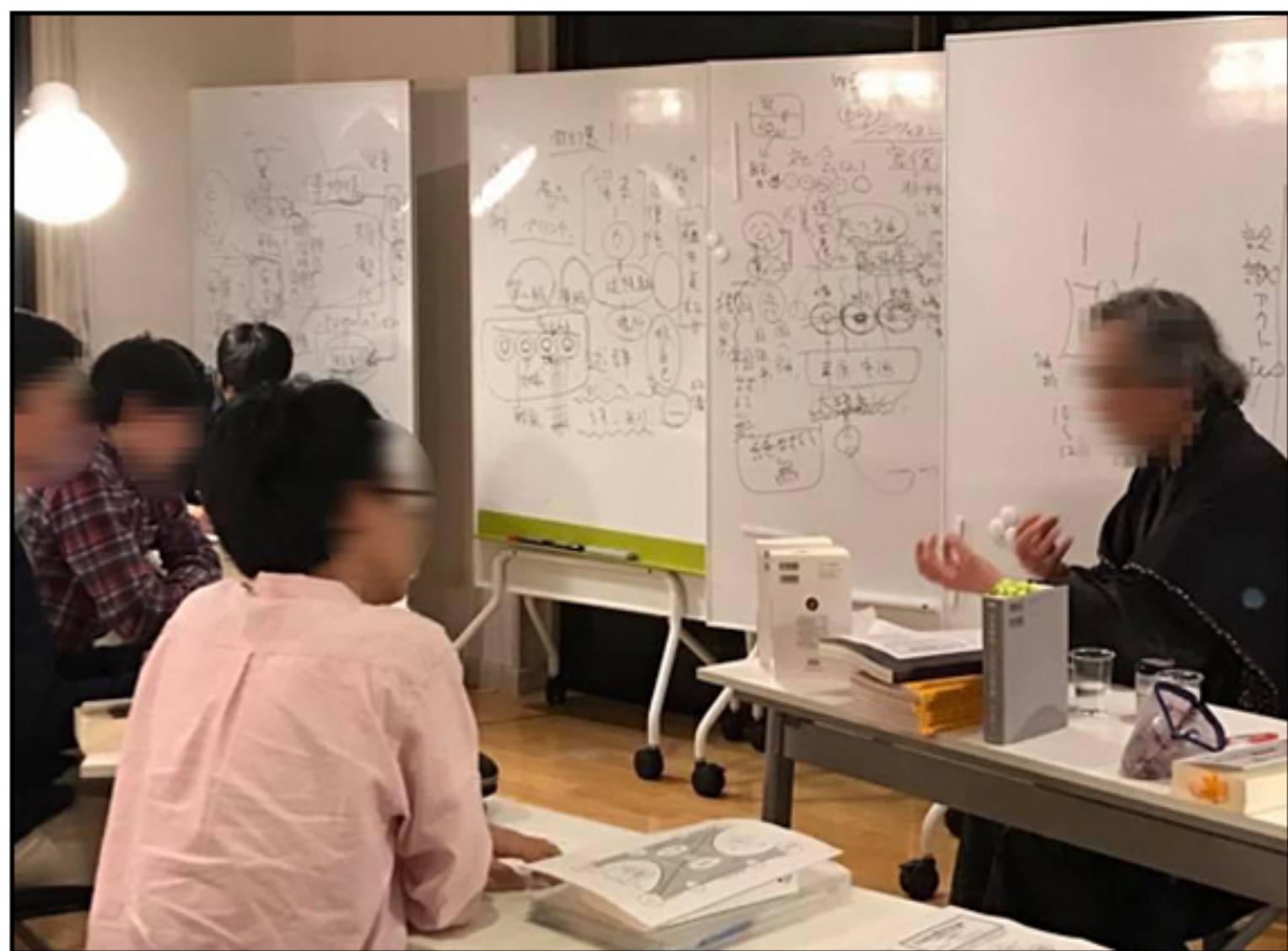
KOMAD 学生及び教授の講義の様子2