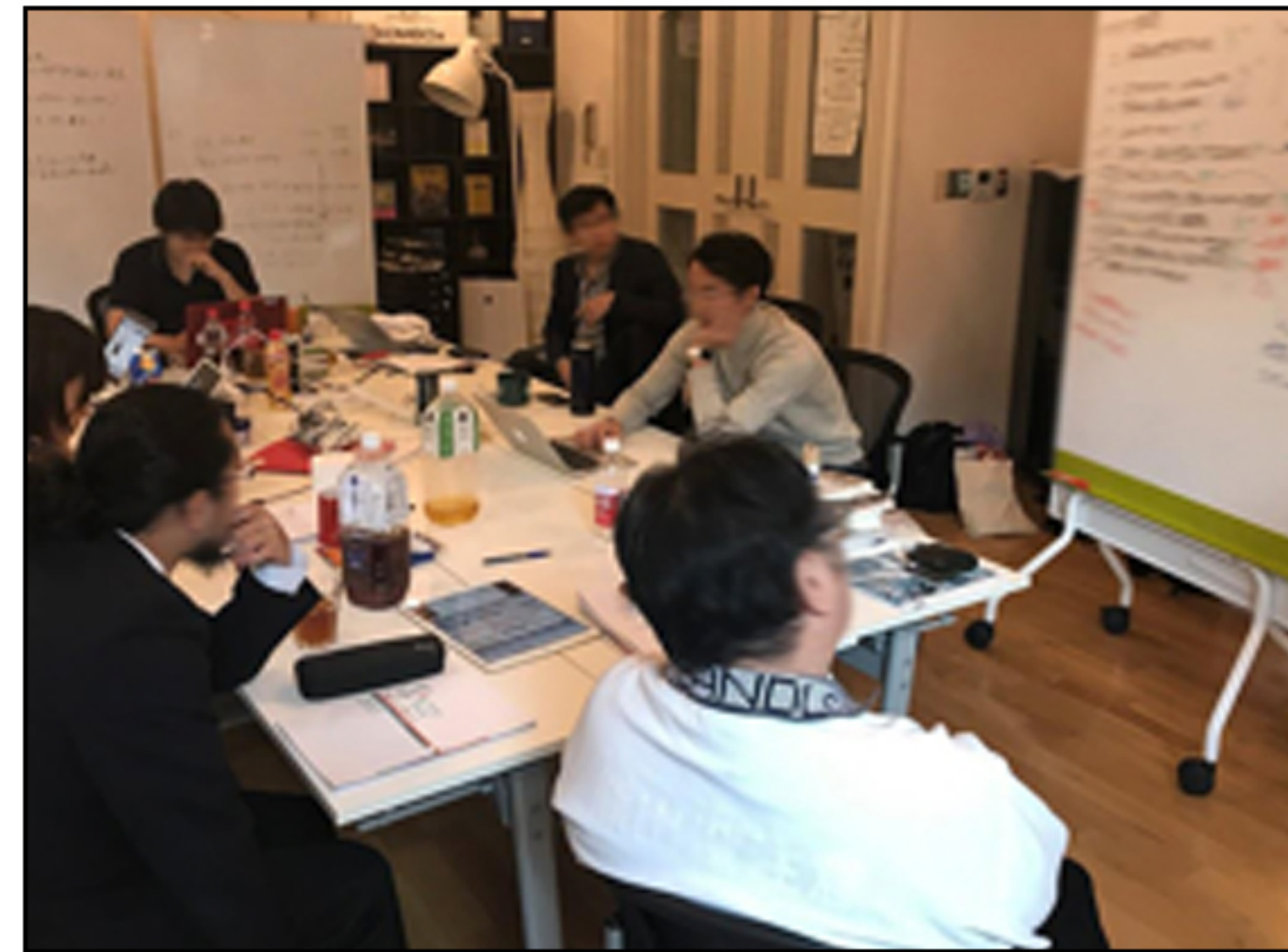
KOMAD 学生及び教授の講義の様子