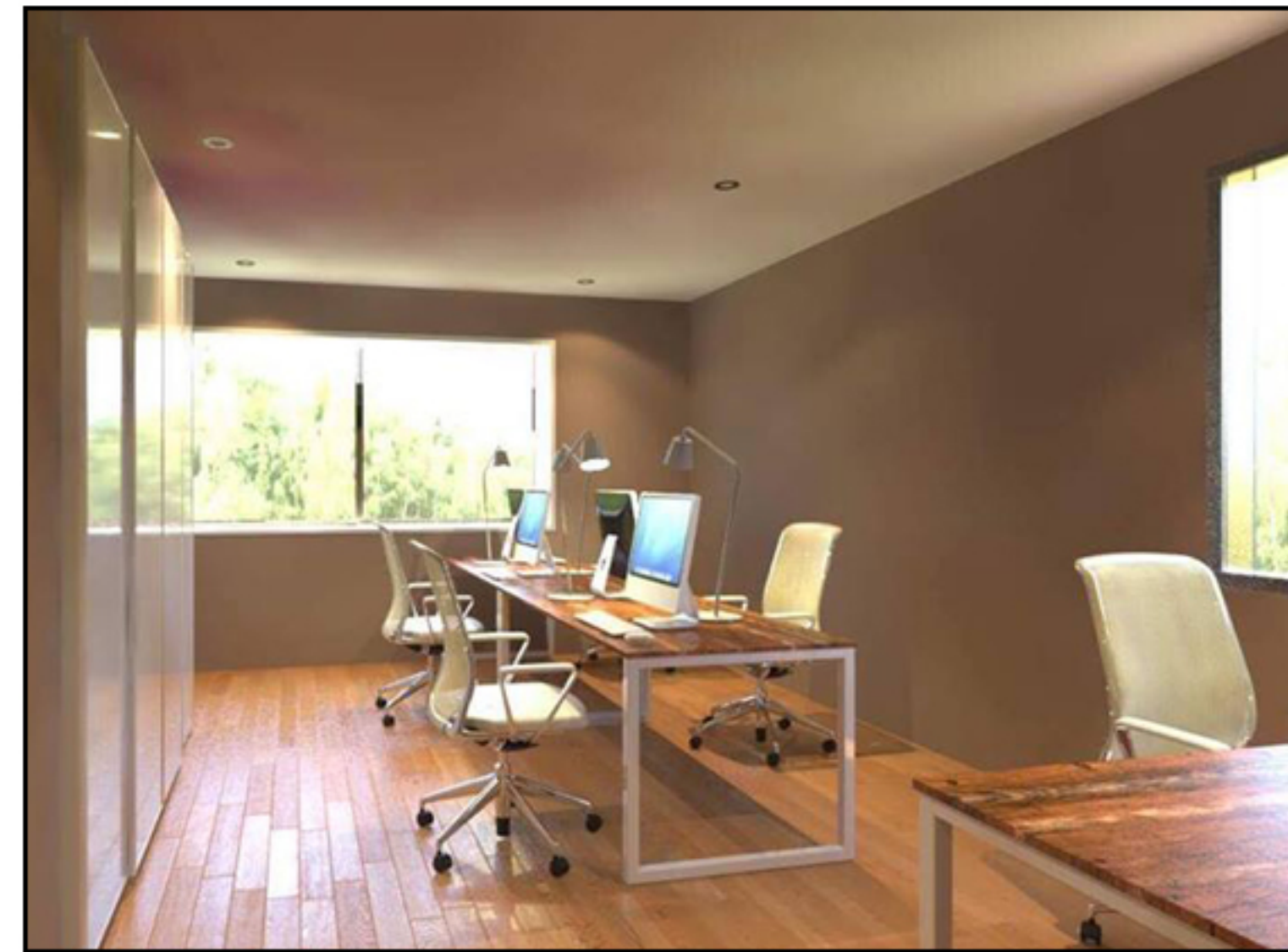
東京オフィス 執務エリア