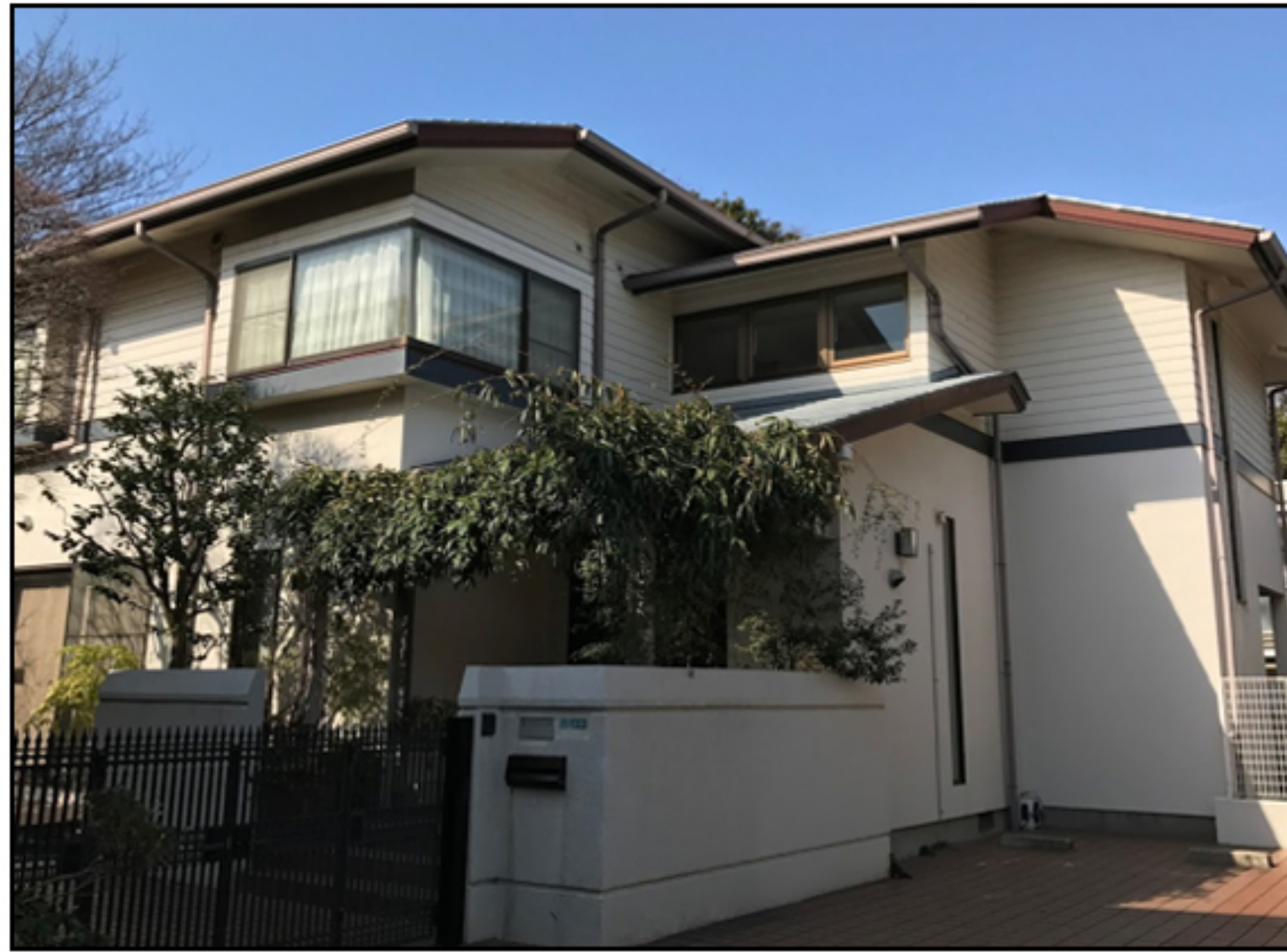
東京オフィス・KOMAD外観